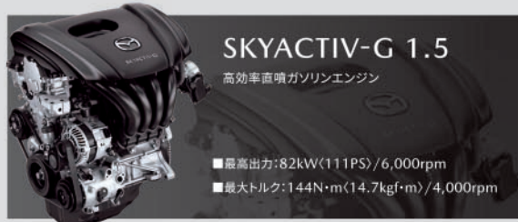
SKYACTIV-G 1.5 高効率直噴ガソリンエンジン

■最高出力:82kW(111PS)/6,000rpm ■最大トルク:144N・m(14.7kgf・m)/4,000rpm