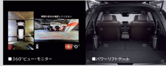
■360°ビュー・モニター ■パワーリフトゲート