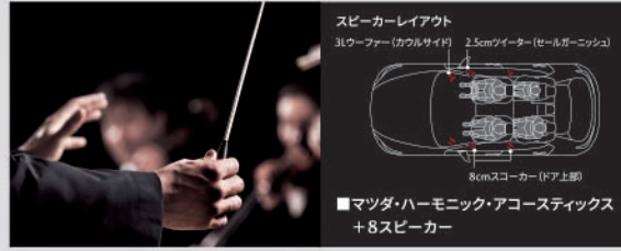
スピーカーレイアウト 3クワーター(カウルサイド) 2.5cmツイーター(セールガーニッシュ) 8cmスクーアー(ドア上部) ■マツダ・ハーモニック・アコースティクス +8スピーカー