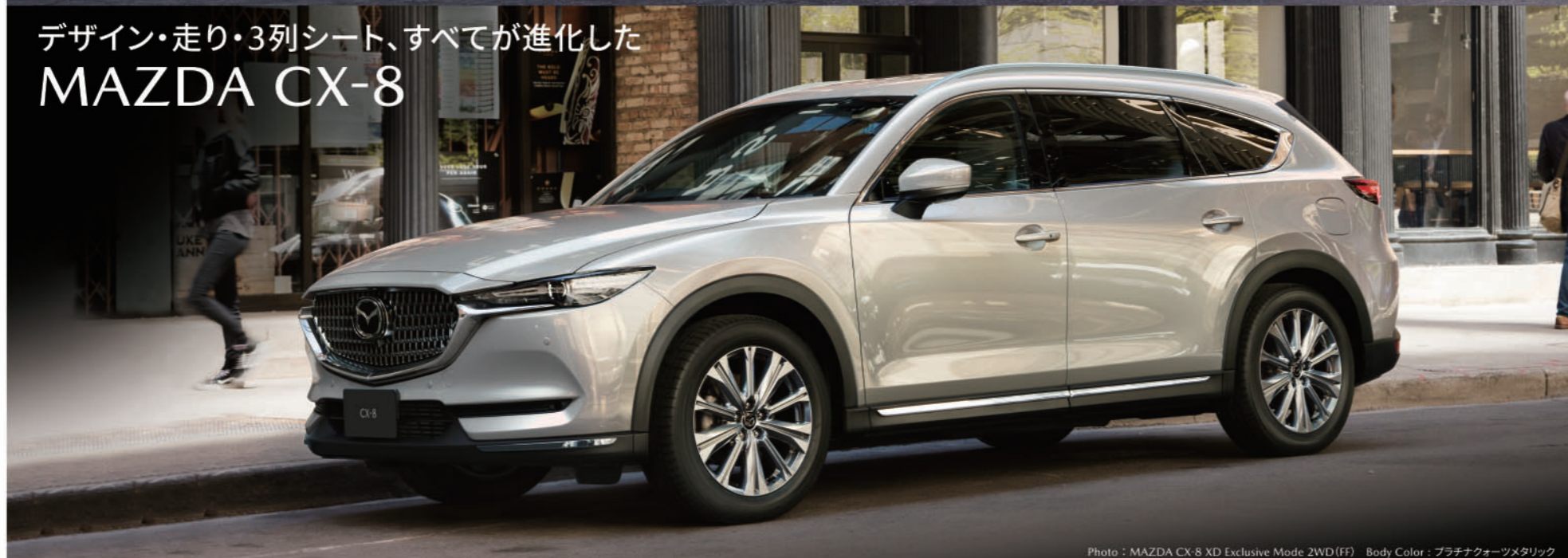
Photo : MAZDA CX-8 XD Exclusive Mode 2WD (FF) Body Color : プラチナオーツメタリック