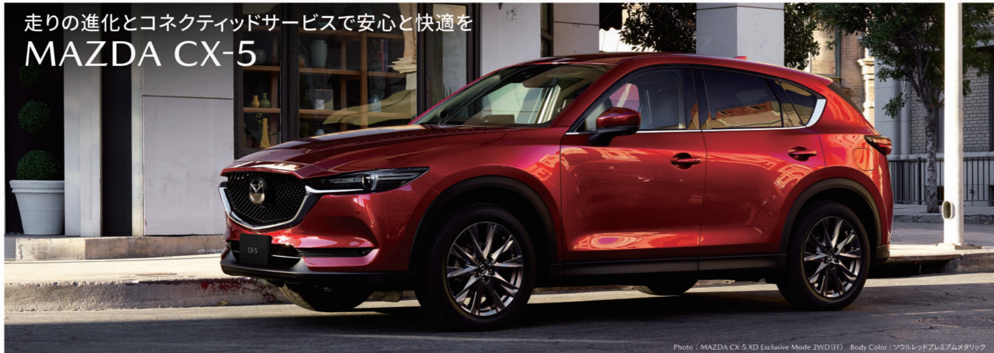
Photo : MAZDA CX-5 XD Exclusive Mode 2WD (FF) Body Color : ソウルレッドプレミアムメタリック