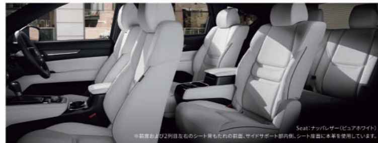
一部グレードには、2列目シートにもシートヒーターや熱のこもりを吸い出すベンチレーション機能を装備。高い質感と機能性を両立しました。

※[Exclusive Mode]6人乗りはセンターシートに一部機能が追加されているため、7人乗りより165,000円(消費税10%込)高となります。 ※シートの素材・カラー・6人乗り/7人乗りの選択肢、及びシートに付属する機能はグレードによって異なります。※装備の詳細については、営業スタッフへお問い合わせください。