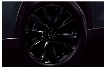
225/55R19タイヤ&19インチアルミホイール (ブラックメタリック塗装)