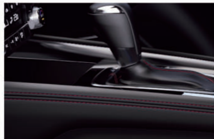
ニールレストパッド(合成皮革):ブラック/レッドステッチ付 ニールレストパッド部(インナーパネル):ブラック