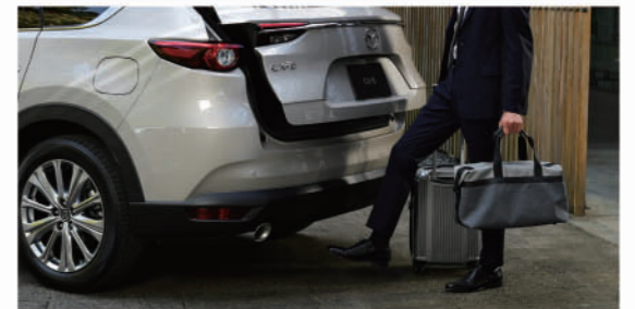
荷物などで両手がふさがっていても、スムーズにリアゲートを開閉できます。