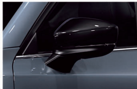
電動格納リモコン式カラードアミラー(オート格納) (グロスブラック)/ヒートドアミラー