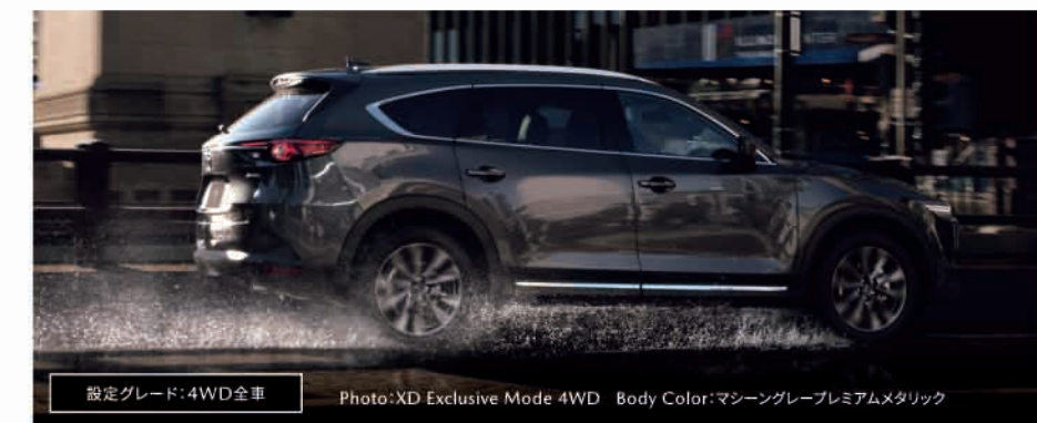
設定グレード: 4WD全車 Photo: XD Exclusive Mode 4WD Body Color: マッシュングレープレミアムメタリック

悪路走破性を向上させる新開発技術“オフロード・トラクション・アシスト”を4WD全車で標準装備。悪路からの脱出が困難な状況においても、オフロード・トラクション・アシストを動作させることで、タイヤの空転を抑制。スタックの脱出をサポートします。ご家族でどこへドライブに出かけても安心の機能です。