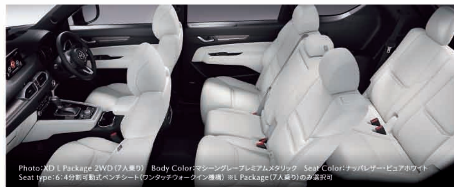
Photo: XD L Package 2WD (7人乗り) Body Color: マッシュングレープレミアムメタリック Seat Color: ナッパレザービュアホワイト Seat type: 6:4分割可動式ベンチシート(ワンタッチフォワード倒機構) ※L Package (7人乗り)のみ選択可

3列シートを持つSUVとして目指したのは、乗る人が心身ともに実感できる走りの気持ちよさと上質な快適性です。必要十分な室内の広さを確保するとともに、自然な姿勢を支える構造によって、どのシートに座ってもロングドライブを心から楽しむことができます。