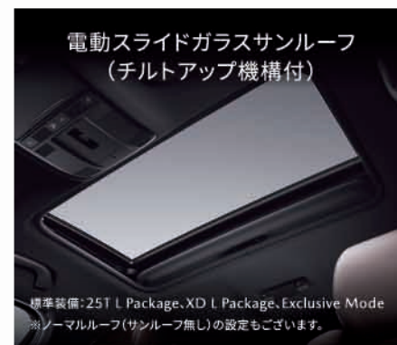
電動スライドガラスサンルーフ (チルトアップ機構付)

※前席および2列目左右のシート背もたれの前面、サイドサポート部内側、シート座面に本革を使用しています。 ※インテリアの画像は点灯状態を演出しています。 ※モニター画面はハメ込み合成です。