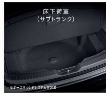
床下荷室 (サブトランク)