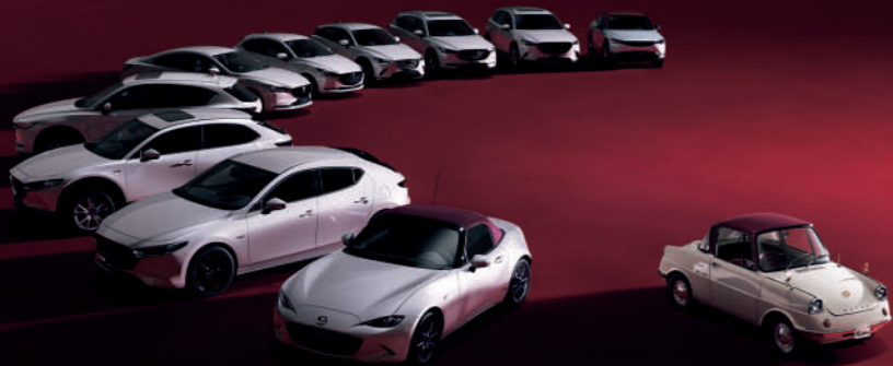
※画像はグローバルのラインナップです。(R360クーペを除く)

創立100周年を記念した、特別なカラーコーディネーションやスペシャルロゴを採用しています。