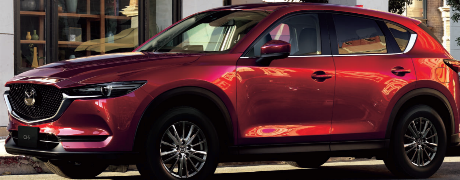
Photo:20S SMART EDITION 2WD Body Colorソウルレッドクリスタルメタリック