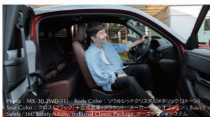
Photo: MX-30 2WD (FF) Body Color: ソウルレッドクリスタルメタリック(3トーン) Seat Color: クロス(ブラック)＋合成皮革(ブラック)メーカーセットオプション: Basic Safety/360°Safety/Utility/Individual Classic Package、エアサスペンションシステム

センターオープン式のドアを開放することで、外の世界と室内空間が一体となったかのような開放感を味わえど共に、お客様の乗り降りのしやすさなど、使い勝手のよさも提供します。