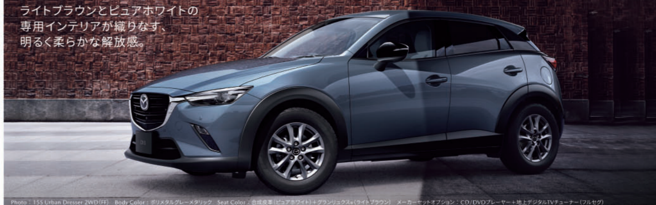
Photo: 15S Urban Dresser 2WD (FF) Body Color: ポリメタルグレーメタリック Seat Color: 合成皮革(ビュアホワイト)＋グランリユクス(ライトブラウン) メーカーセットオプション: CD/DVDプレーヤー＋地上デジタルTVチューナー(フルセグ) ※前排および後座左右のシートにもたれ防止の前面、サイドサポート部内装、シート裏面に合成皮革を使用しています。シート裏面および背もたれの一部にグランリユクスを使用しています。※「グランリユクス」はセーレン株式会社の子会社商標です。*画像は点灯状態を演出しています。*インテリアの画像は点灯状態を演出しています。*モニター画面はハメ込み合成です。

ライトブラウンとビュアホワイトの専用インテリアが織りなす、明るく柔らかな解放感。