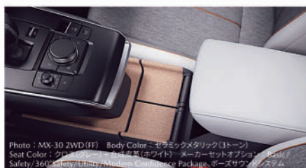
Photo: MX-30 2WD (FF) Body Color: セラミックメタリック(3トーン) Seat Color: クロス(グレー/ブラック)＋合成皮革(ホワイト) メーカーセットオプション: Basic Safety/360°Safety/bluetooth/Modern Convenience Package、エアサスペンションシステム

ユニークなデザインのフローティングコンソールには、コルク素材を採用。素材の持つ自然な魅力を引き出し、コルクならではの温もり感のある見た目と手触りを実現しました。