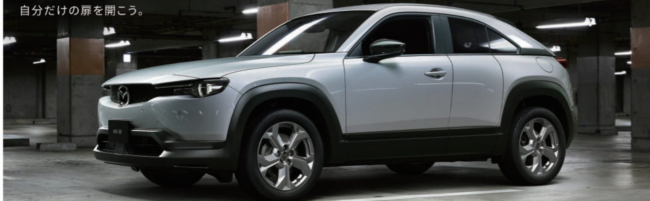
Photo: MX-30 2WD (FF) Body Color: セラミックメタリック Seat Color: クロス(グレー/ブラック)

マイルドハイブリッドモデル MX-30 e-SKYACTIV G 2.0 2WD (FF) (6EC-AT) 車両本体価格 2,420,000円 (消費税込★)