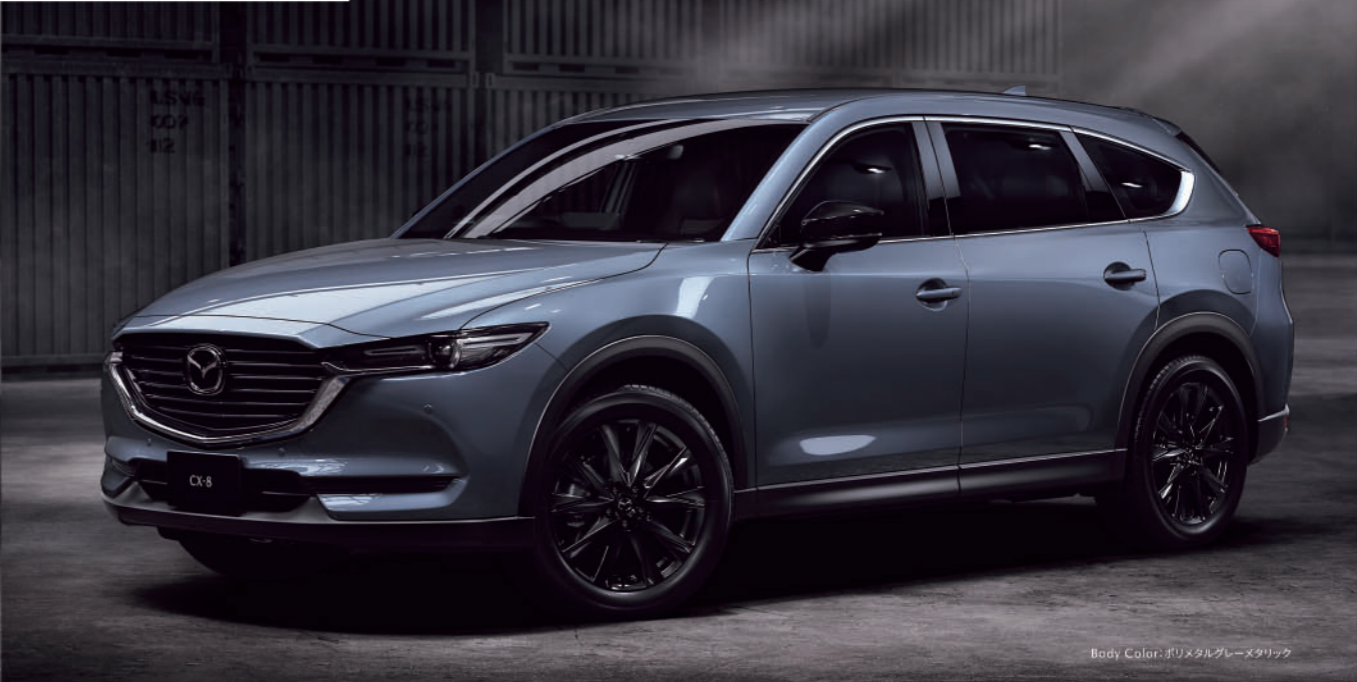
Body Color: ポリメタルグレーメタリック