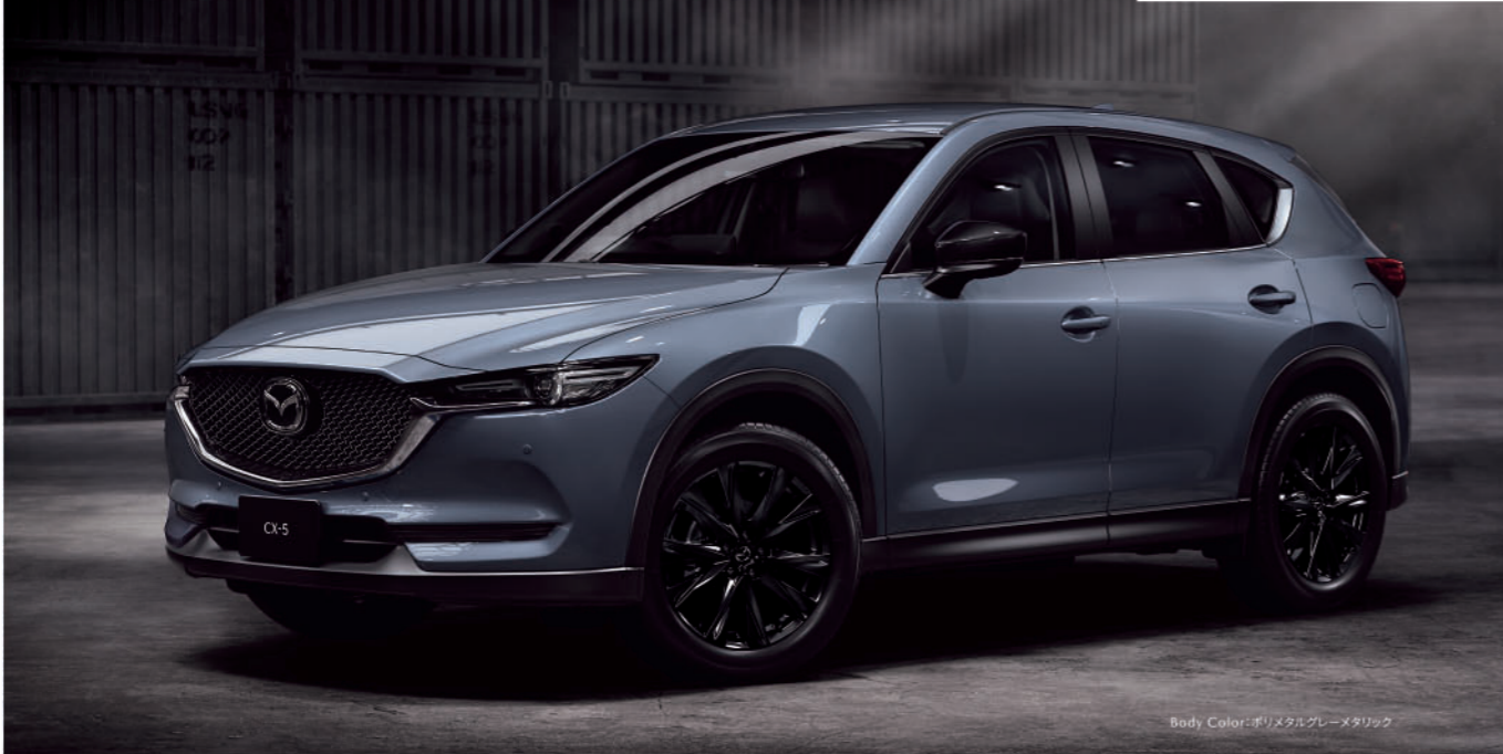
Body Color: ポリメタルグレーメタリック