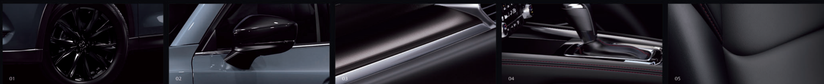
Photo: MAZDA CX-5 Black Tone Edition

MAZDA CX-5 Black Tone Edition / MAZDA CX-8 Black Tone Edition 主な特別装備