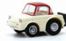
2020年にマツダ創立100周年を記念して作られたR360 COUPEのチョロQです。

ご応募・抽選について 右記の条件を全て満たした投稿を頂いた方が応募・抽選の対象となります。