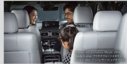
Photo: XD Exclusive Mode 2WD Body Color:プラチナクォーツメタリック Seat Color:アップルグレー(ビュアホワイト)