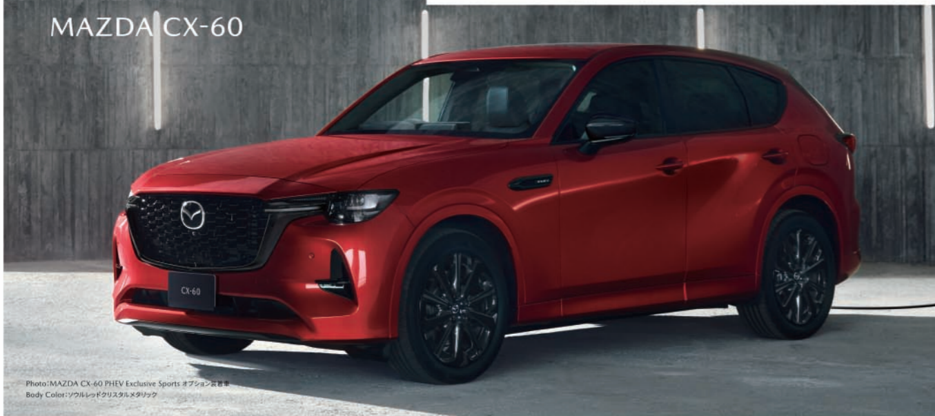
Photo: MAZDA CX-60 PHEV Exclusive Sports オプション装着車 Body Color: ソウルレッドクリスタルメタリック