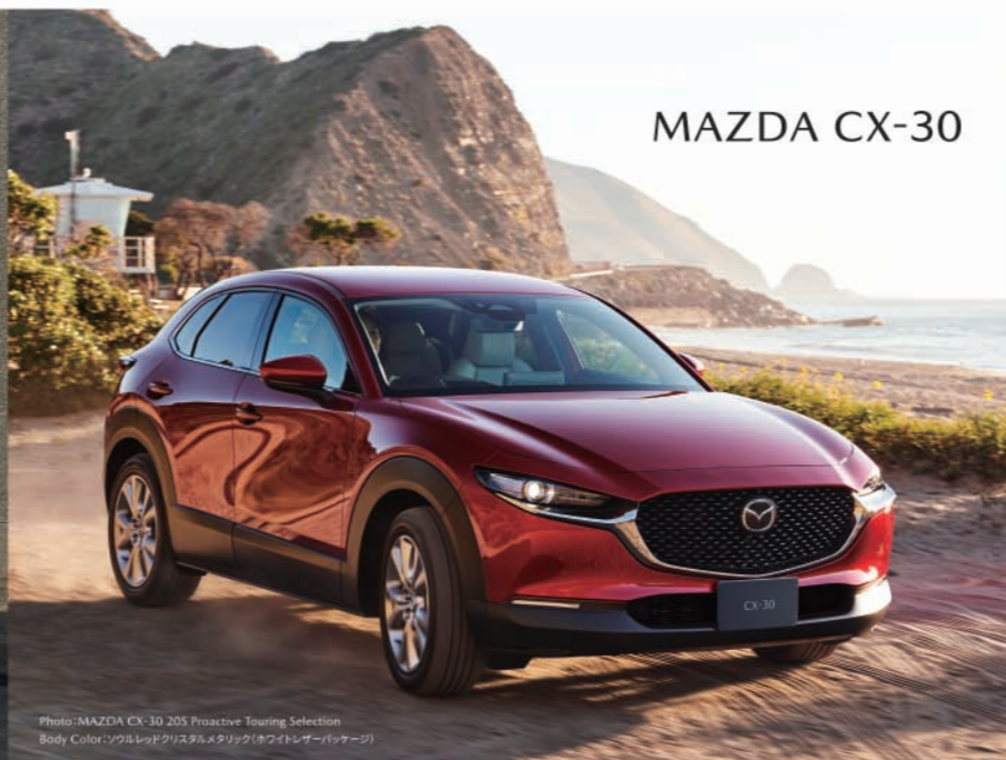
Photo: MAZDA CX-30 205 Proactive Touring Selection Body Color: ソウルレッドクリスタルメタリック(ホワイトレザートンナージュ)