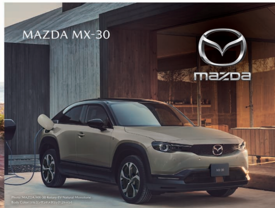
Photo: MAZDA MX-30 Rotary-EV Natural Monotone Body Color: シルコンゴールドメタリック(2トーン)