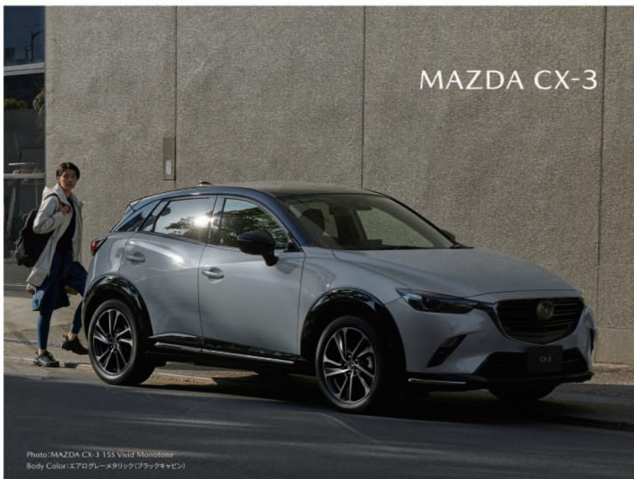
Photo: MAZDA CX-3 155 Vivid Monotone Body Color: エアログレーメタリック(ブラックキャビン)