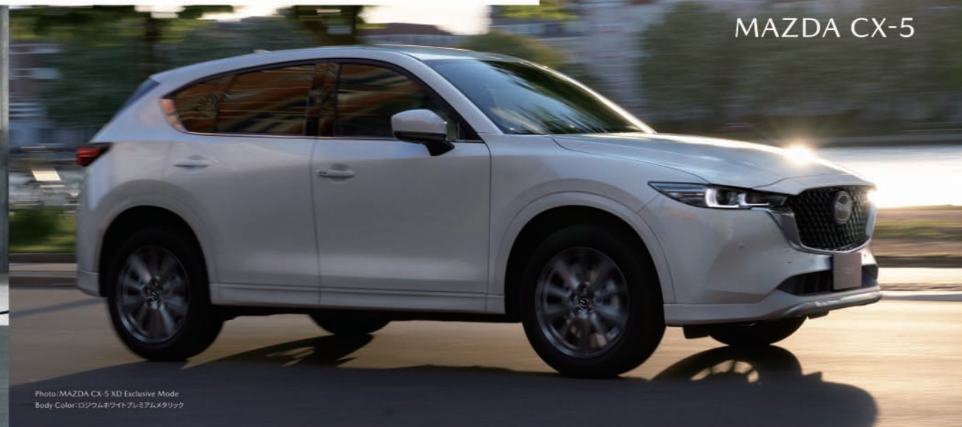
Photo: MAZDA CX-5 XD Exclusive Mode Body Color: ロジウムホワイトプレミアムメタリック